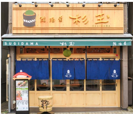
<『鮨・酒・肴 杉玉 神楽坂』外観>