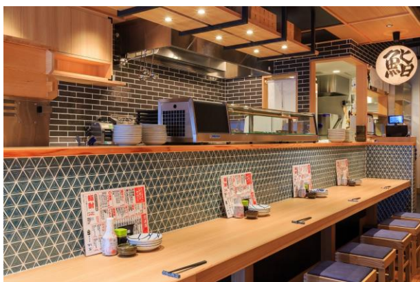
<店舗内観イメージ①>