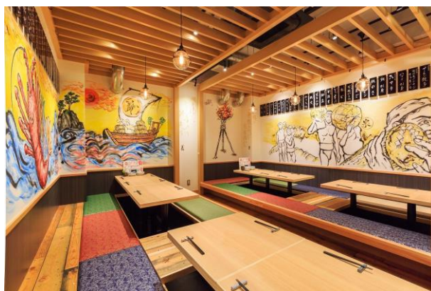
<店舗内観イメージ②>