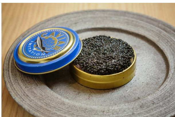
<商品一例（キャビア寿司）>