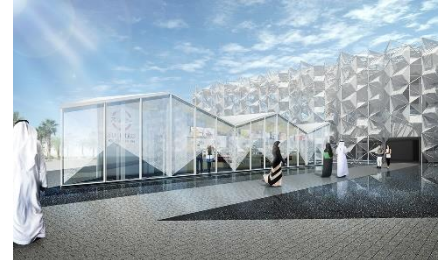
「スシロードバイ万博店」パースイメージ