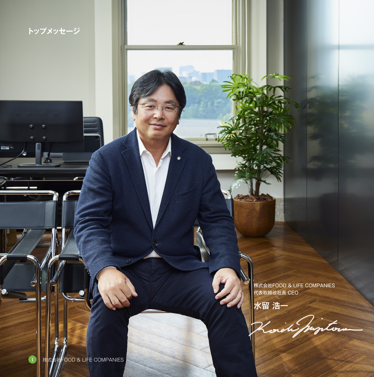
株式会社FOOD & LIFE COMPANIES 代表取締役社長 CEO