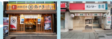
「回転寿司みさき 高円寺店」「京樽・スシロー 行徳店」

国内スシローブランドは51店舗の新規出店を果たし、特にテイクアウト専門店「スシロー To Go」として新たに15店舗を出店。2021年4月より株式会社京樽が運営するテイクアウト寿司「京樽」、回転寿司「海鮮三崎港」、寿司専門店「すし三崎丸」などを含め、国内は合計938店舗となりました。このうち、事業拡大の一環としてダブルブランド店舗「京樽・スシロー」を同年7月からオープンしています。なお、「海鮮三崎港」は11月に「回転寿司みさき」としてリブランディングを実施し、より強化した商品ラインアップをお客様に提供しています。