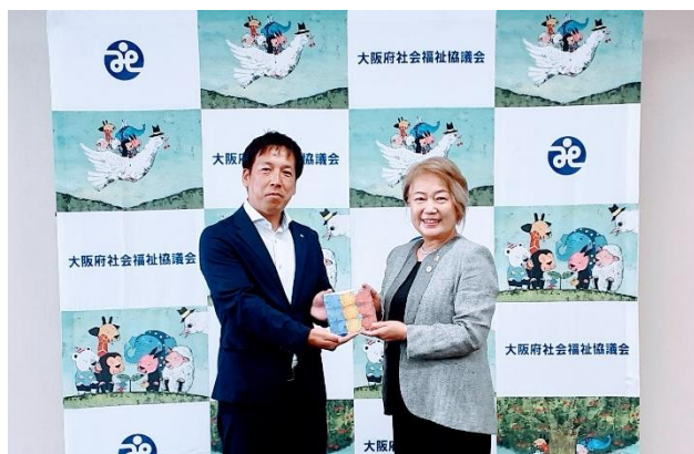
大阪府福祉協議会での寄贈式

また、回収したパーティションの一部を知育玩具の立体型パズルへとアップサイクルし、大阪府社会福祉協議会を通じて、大阪府内の施設で暮らすお子さまたちへ、8月21日に寄贈いたしました。F&LCは、今後も環境に配慮した事業活動を行うとともに、地域社会への貢献にも取り組んでまいります。